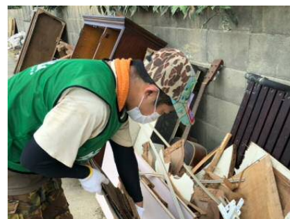
2018年7月～8月（愛媛県） 愛媛大洲店 災害復興ボランティア

【ご参考】ダイナムグループ社会貢献活動ブログ⇒ http://dynam.lekumo.biz/dynamblog/