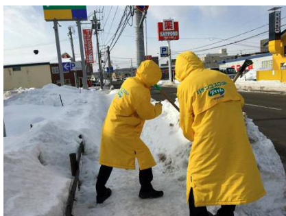
2019年1月（北海道） 北海道札幌清田店 地域の除雪