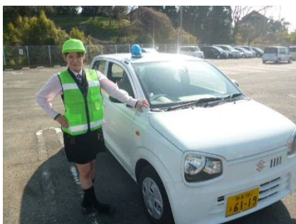
2018年12月（熊本県） 松橋店 防犯パトロール